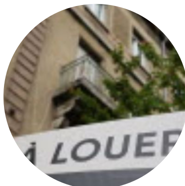
Avec des loyers de plus en plus élevés et des biens plus rares, le marché locatif reste sous tension