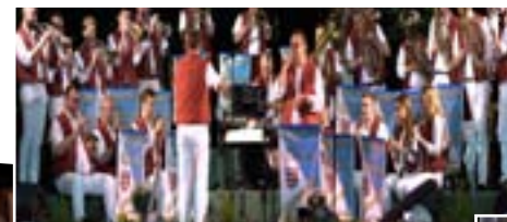
L'ensemble Saint Barthélemy aus Durrenbach (Elsass)

Sonntag, 17. September: 11.00 Uhr - 20.30 Uhr: Musikunterhaltung mit dem Orchester