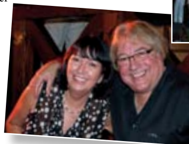
"Duo Kleinmann" aus Herrlisheim (Elsass)

11.00 Uhr - 22.00 Uhr Musikunterhaltung mit dem Orchester