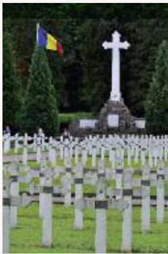
Cimetière militaire Roumain

Documentant les combats et les conditions de vie des soldats, le musée Serret, inauguré en 1973 à Saint-Amarin, occupe un ancien tribunal qui avait servi, pendant la Grande Guerre, d'hôpital mobile alsacien. En suivant l'ancienne ligne de front vers la vallée Noble se trouve la plus grande nécropole militaire roumaine de France, le cimetière militaire roumain de Soultzmatt, inauguré en 1924 par le roi Ferdinand et la reine Marie de Roumanie.