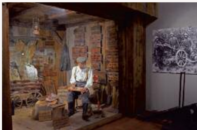
Musée du Linge

Depuis la frontière suisse jusqu'à la mer du Nord en passant par les Hautes-Vosges, le front se stabilise