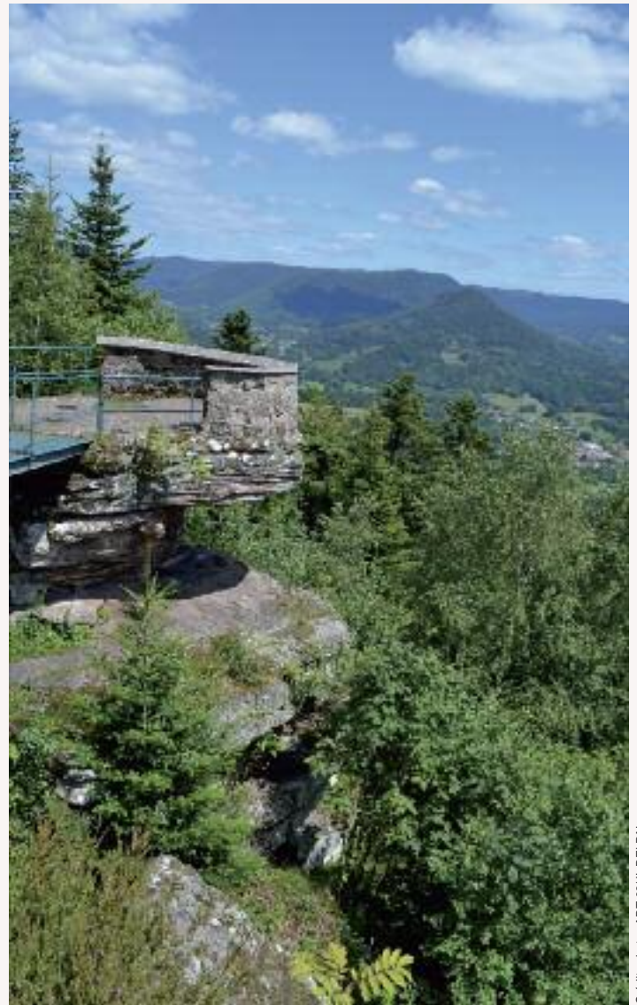
La Roche Mère Henry

Près de Moyenmoutier, c'est dans le Val de Senones, ancienne capitale de la Principauté de Salm, que les Allemands se fixent dès le mois de septembre 1914. Le promontoire de la Roche Mère Henry, accroché sur la