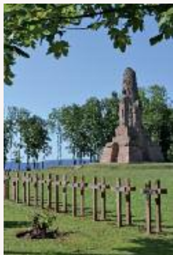
La nécropole de Fontenelle

Dans la vallée du Hure, les hauteurs de la Fontenelle sont l'enjeu d'une guerre de positions qui se mue bientôt en guerre des mines. Un monument est inauguré en 1925 près de la nécropole où reposent 2 348 Français.