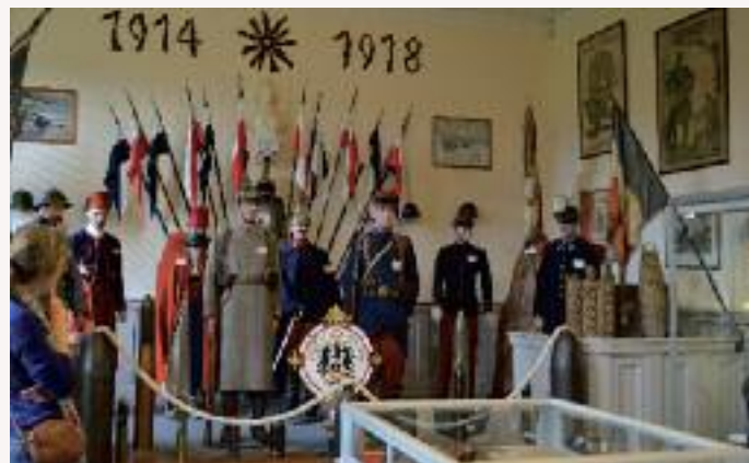
Musée de Serret

Par contre pour la France, la libération de l'Alsace est un impératif psychologique essentiel (d'où les attaques initiales) tandis que les Allemands ne pouvaient pas laisser prendre impunément Mulhouse, la seule grande