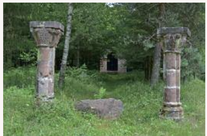
Site de la Chapelotte