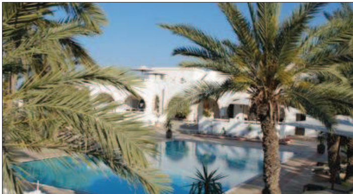
À Djerba, la piscine entourée de palmiers est un des attraits de l'hôtel de Dominique Beck.

Quatre ans après, il témoigne : « Cette journée du mercredi 20 juin 2007 restera à jamais gravée dans ma mémoire. J'ai cru rêver en découvrant toutes mes serres détruites, 90 % des vitres brisées, les écrans