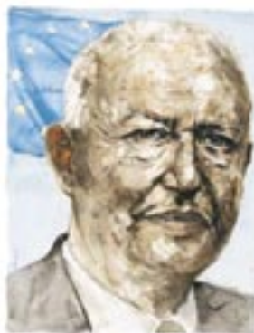
In Memoriam Pierre PFLIMLIN

Il a édité l'oeuvre d'orgue de Bach, en collaboration avec Widor, et laisse de nombreux ouvrages, dont J.S. Bach, le musicien-poète. En 1952, il reçut le prix Nobel de la Paix.