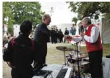
Dr. Schuster, Maire de Stuttgart

Le 21 septembre, le 4 e „Stuttgarter Bürgerfest“ (= Fête des citoyens) sous le patronage du Dr. Schuster, Maire de Stuttgart, a eu lieu au parc du Killesberg. Tous les deux ans, dans un parc de 50 ha, les clubs de Stuttgart tiennent des stands pour mieux se faire connaître. Jusque dans la soirée, les visiteurs du parc ont honoré les pavillons du Club des Alsaciens de Stuttgart avec prospectus et informations sur l'Alsace, vins d'Alsace et surtout les savoureuses tartes flambées,