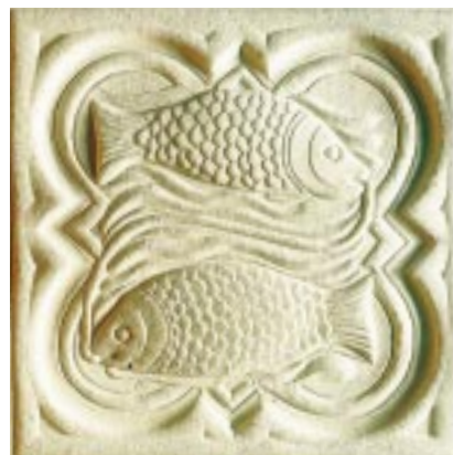
Reproduction en relief dans le papier d'une sculpture de la cathédrale : Signe des Poissons.

L e « livre sculpté » de la cathédrale de Strasbourg constitue, en lui-même, une prouesse technique. La fabrication artisanale, l'impression typographique à l'ancienne, le choix des papiers chiffons, permettent de restituer dans toutes leurs nuances vingt-quatre sculptures qui ornent le portail droit de la façade principale : les douze Signes du Zodiaque et les douze Travaux des Mois, qui nous révèlent la manière dont nos lointains parents se représentaient la vie et le cosmos.