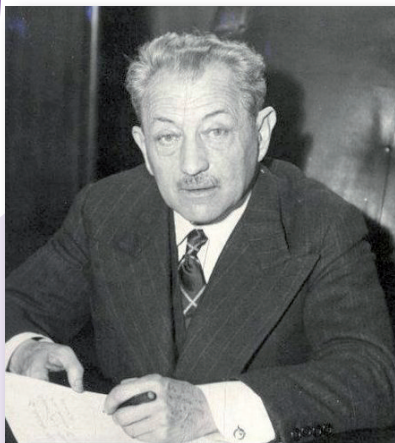
Eugène Schueller dans les années 1950

Si les feux de l'actualité se sont braqués récemment sur le nom de Liliane Bettencourt qui fut la femme la plus riche de France, celui de son père, Eugène Schueller, est moins connu alors que c'est lui qui fut à l'origine de cette fortune en tant que fondateur du groupe L'Oréal. Comme