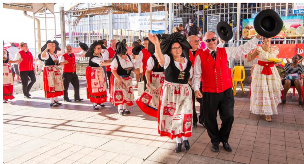
Par 31 degrés à l'ombre, L'Accordina a dansé tout son répertoire...