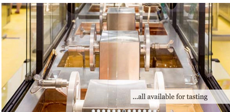
...all available for tasting