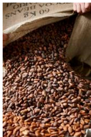
fairtrade cocoa beans