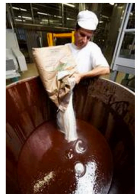
Sugar and milk give a kick to the mixture.