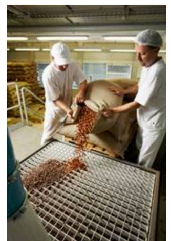
are processed directly.