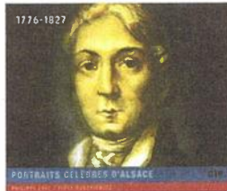
Louis Henri Bojanus Le savant de Vilnius

1832 m. Vilniuje buvo išspausdintas L. H. Bojanuso kapitalinis veikalas, kurį jis iliustravo „Anatome Testudinis Europaeae“. Pakartotinės jo laidos buvo pakartotos Vokietijoje 1902 m. ir JAV – 1970 m. Elektroninio šio jo veikalų variantą Harvardo universitetas parengė kaip pagrindinį veikalą, reikalingą veterinarijos stu-