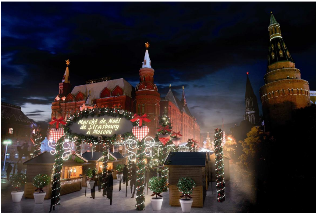
Vue générale du 1 er Marché de Noël de Strasbourg à Moscou, place du Manège, à l'entrée de la Place Rouge (à droite : le Kremlin, au centre : le Musée national d'histoire)

Pour la première fois, la capitale de la Russie accueillera un événement festif d'envergure européenne pour les fêtes de Noël : le 1 er marché de Noël de Strasbourg à Moscou.