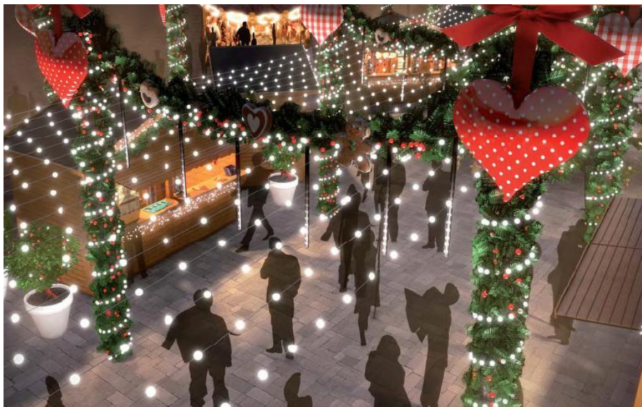
Les décorations créées exclusivement pour l'occasion

Des décorations exclusives seront importées pour l'occasion, et un motif créé pour l'événement jalonnera le parcours.