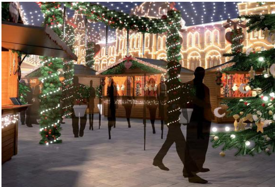
Les célèbres chalets de Noël de Strasbourg

20 chalets identiques à ceux que l'on trouve à Strasbourg seront installés sur la place du Manège. 15 seront fabriqués par un artisan alsacien et acheminés spécialement pour l'événement et 5 autres fournis par Vologda, ville partenaire de Strasbourg en Russie.