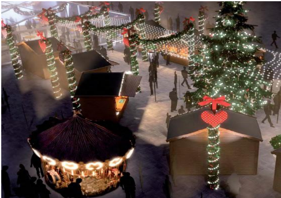
Le grand sapin, le manège pour les enfants et le rideau de lumière

L'inauguration aura lieu le 23 décembre 2012 en soirée, en présence d'une délégation de la Ville de Strasbourg.